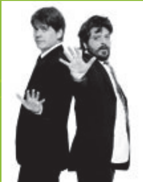
Peter & Anders Lund Madsen