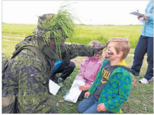
Ceremoni på Ole Lund Kirkegård, hvor Ole Lund Kirkegård blev dedikeret som historisk minde.