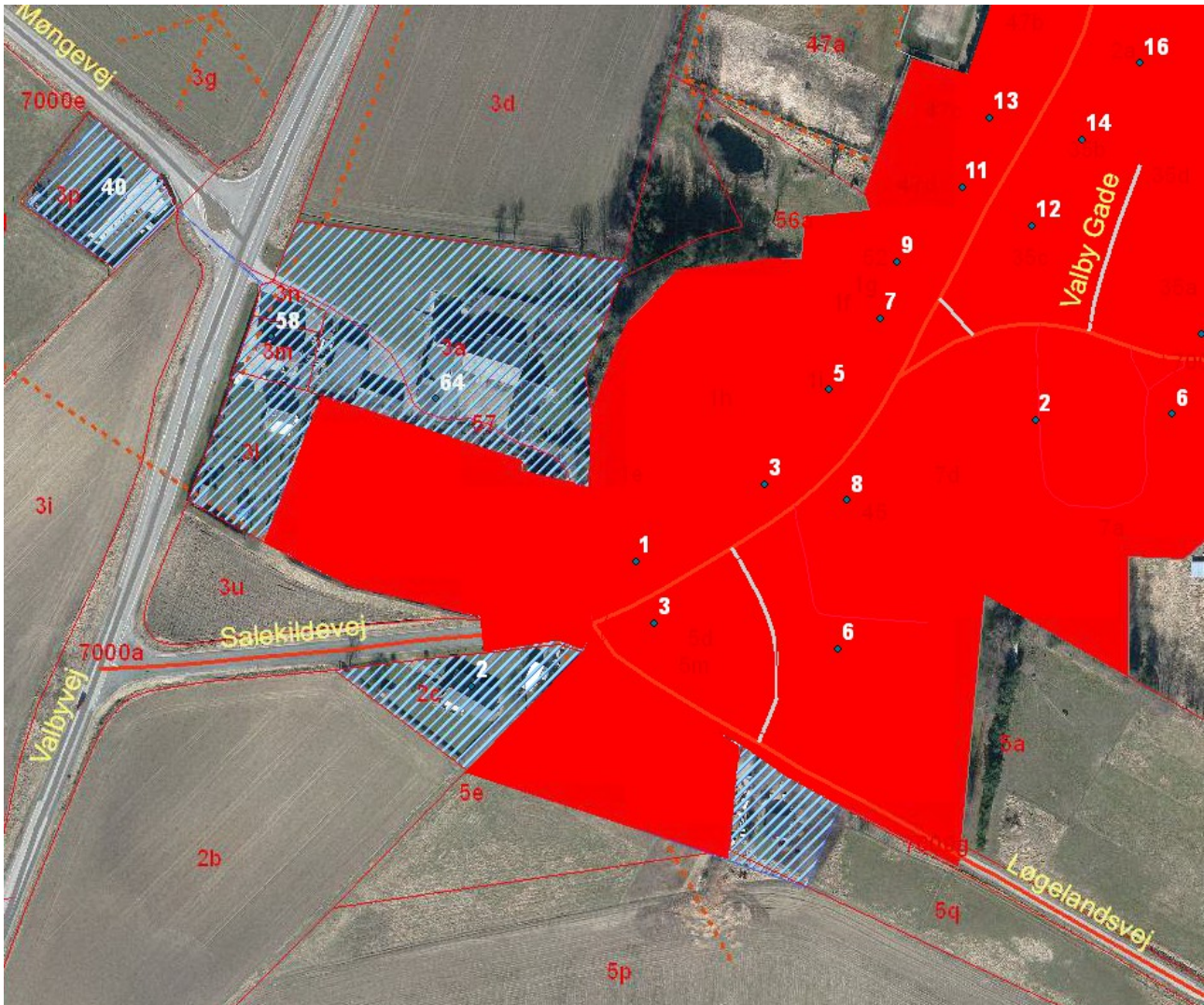
Figur 1 Kloakopland VAL11SN (del af Valby), markeret med stiplet de ejendomme der udtages af spildevandsplanen som kommende kloakeringsopland. Rød markering er kloakeret

*) Befæstet areal der afvandes til kloakken