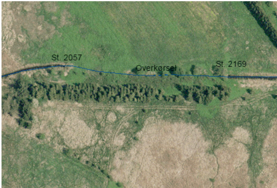
2. Før regulering