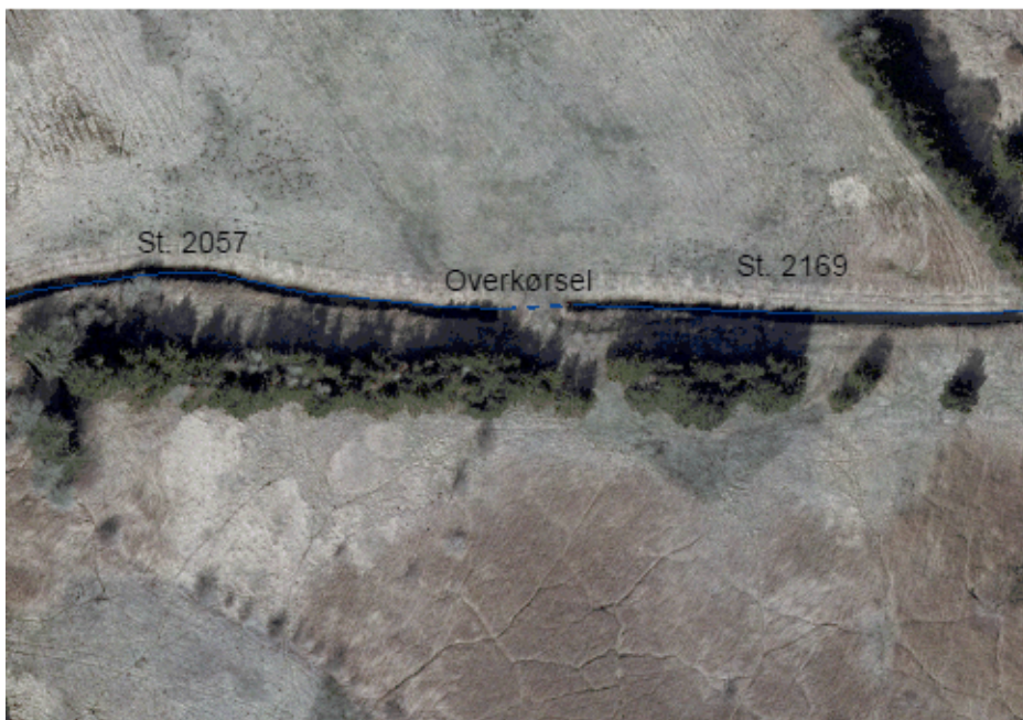
3. Efter regulering

En projektplan blev aftalt med de 4 bredejere på et møde d. 26. november 2002 på rådhuset i Gilleleje.