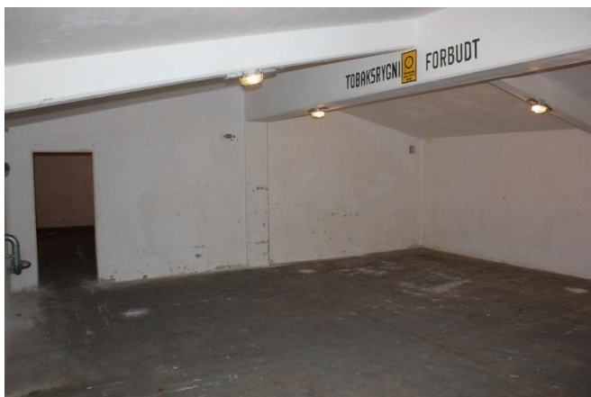
Figur 3. Det højre af de to ens rum.