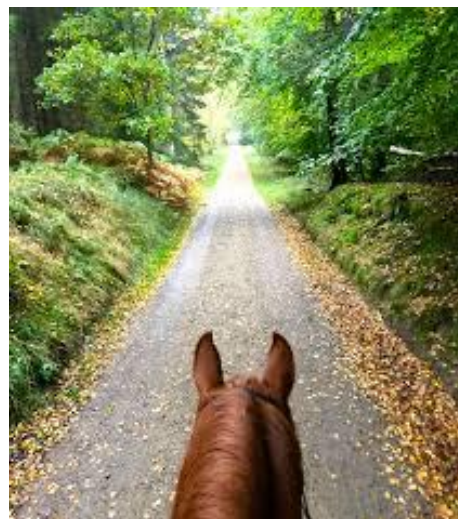
Figur 4. På hesteryg i Gribskov.

Overnatningsmulighed i bunkerne vil øge variationen af friluft- og overnatningsmuligheder i Gribskov, og skabe et interessant udgangspunkt for varierede friluftaktiviteter i området. Formidlingsprojektet vil give det en ekstra dimension, og tilsammen vil det blive en totaloplevelse af læring og oplevelse; historieformidling i et autentisk læringsmiljø, som passer perfekt i folkeskolereformens krav om den åbne skole og læring i virkelighedens verden. Desuden vil det være til gavn for en langt bredere målgruppe.