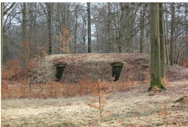
Figur 1. En bunker i Gribskov.

For tiden fjernes de mange bunkere som siden anden verdenskrig har befundet sig i Gribskov. Vi ønsker at bevare 10 – 14 af disse bunkers og indrette to af dem til sheltere. Hermed vil der i Gribskov Kommune blive skabt et spændende nyt friluftstilbud kombineret med autentisk og lokalt forankret historieformidling, som kan være med til at sikre en betydningsfuld lokalhistorisk kulturarv samt skabe anderledes og nytænkende friluftsliv til gavn for borgere og turisme.