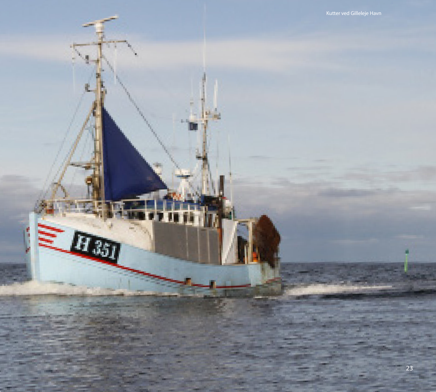
Kutter ved Gilleleje Havn