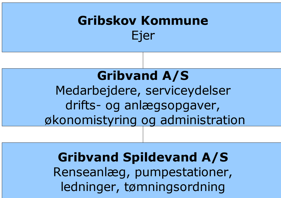
Figur: Organisering af selskaberne, der ejes af Gribskov Kommune.

Gribvand består p.t. af Gribvand A/S og Gribvand Spildevand A/S som begge ejes 100 % af Gribskov Kommune. Selskaberne ledes i det daglige af bestyrelsen og direktøren. Kommunen kan udøve sin direkte ejerindflydelse på selskabernes generalforsamling i forbindelse med godkendelse af regnskab, valg af bestyrelsesmedlemmer mv. men også i forbindelse med beslutninger af væsentlig politisk eller økonomisk betydning, som ifølge vedtægterne skal vedtages på generalforsamlingen. Kommunen kan via denne ejerstrategi yde en indirekte – men også overordnet og langsigtet – indflydelse på selskabernes drift.